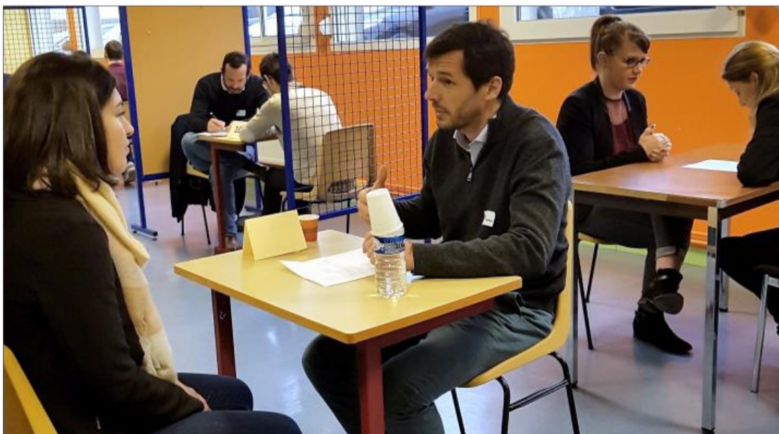
Les élèves avaient sept minutes pour se présenter aux chefs d'entreprise. De quoi les confronter au monde du travail.

Une matinée job-dating était organisée hier matin, au sein de l'établissement cognaçais. L'opération devrait se renouveler.